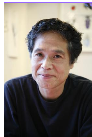
Portrait of Katsumi Komagata

En esta conferencia organizada por la Fundación Japón Madrid en colaboración con el Museo ABC de Dibujo e Ilustración, Katsumi Komagata nos hablará, haciendo un recorrido a través de su obra, sobre cuáles son sus metodologías creativas y cómo deben ser los libros del futuro para los niños. Esta conferencia está dirigida a ilustradores, diseñadores, profesores y público en general.