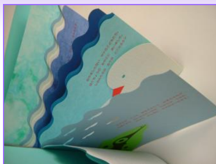
Blue to Blue , Katsumi Komagata, One Stroke, diffusion Les Trois Ourses